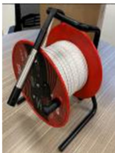
Figura 1. Medidor de temperatura y conductividad eléctrica

continuo de niveles freáticos y temperatura, y un multiparámetro portátil (Figura 3) (Hanna HI98194) para medir parámetros básicos como pH, oxígeno disuelto, conductividad y sólidos disueltos. Estos instrumentos permitirán complementar los análisis isotópicos e hidroquímicos de laboratorio, asegurando una descripción más integral de los procesos de recarga, flujo y descarga en la cuenca.