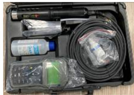
Figura 3. Multiparámetro portátil