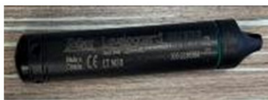
Figura 2. Transductor de presión